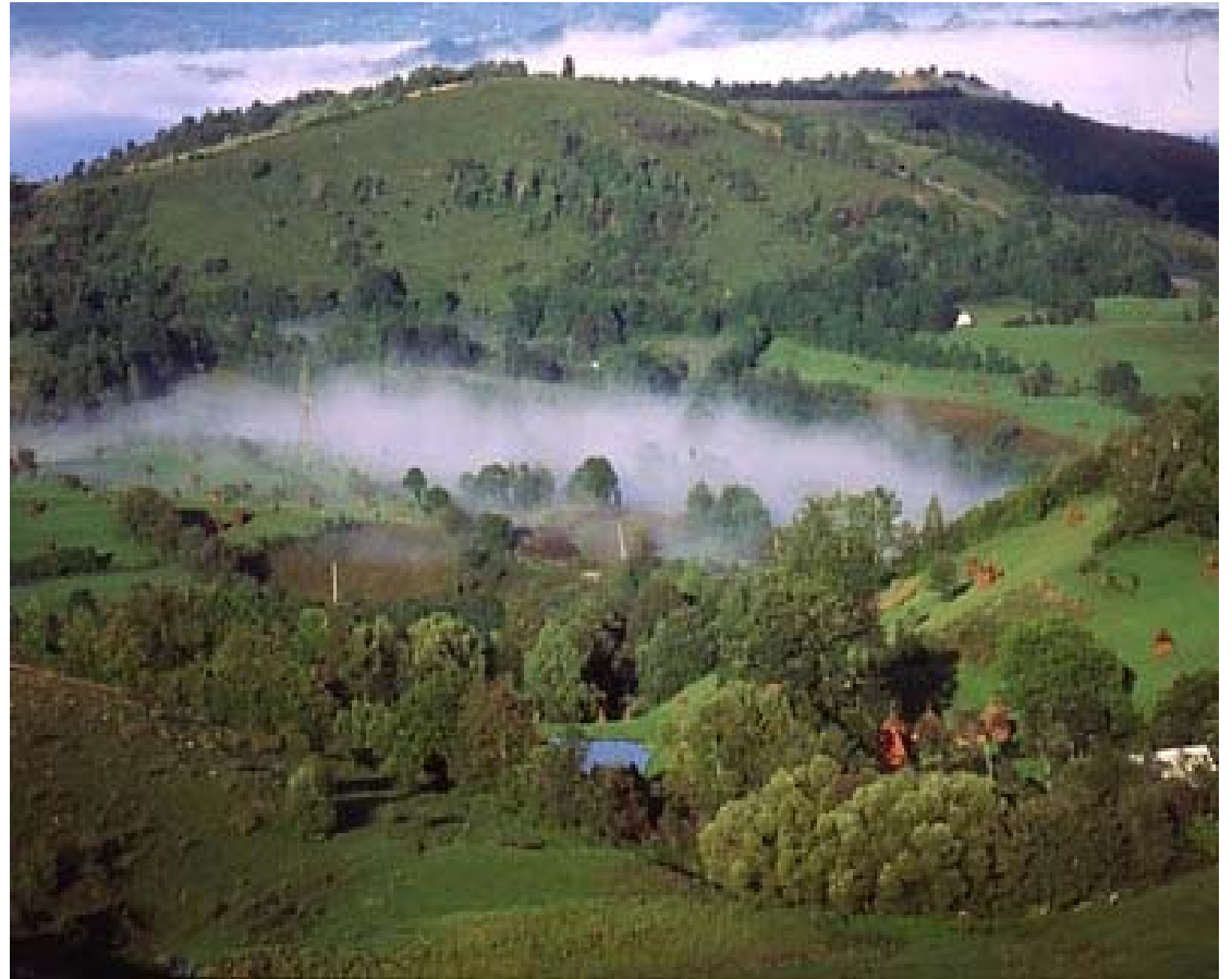
Taul Mare/ Rosia Montana