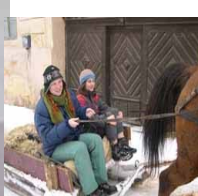
Actiuni în cadrul campaniei Salvati Rosia Montană