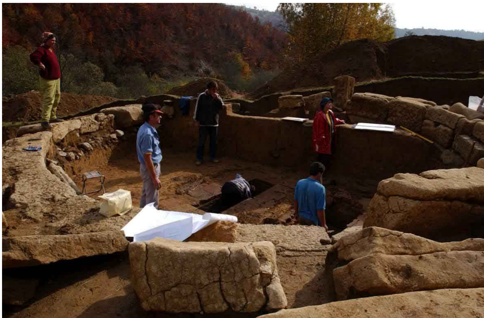
Mausoleum Hop-Gauri/ Rosia Montana